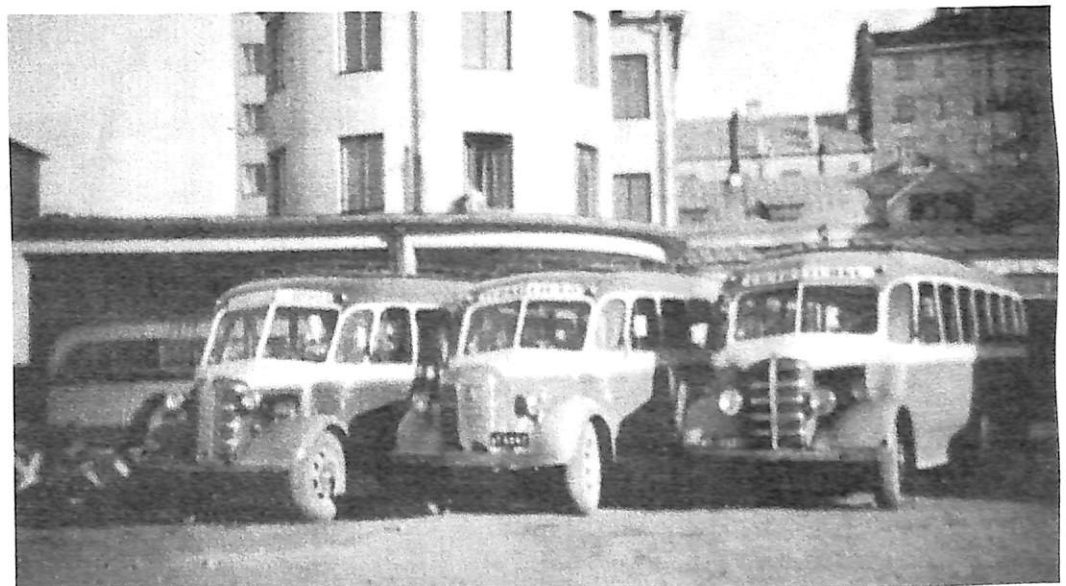
40-luvun uutta kalustoa Turussa Shellin pihalla. Vas. Austin vm. -48, Volvo vm. -47 ja Bedford vm. -49.

Näin linja ohjautui reitille Turku - Maaria - Paattinen - Tortinmäki - Korkeakoski - Tourula. Se ei käynyt lainkaan Yläneen kirkonkylässä. Ensin yrityksellä oli talli Yläneen Korkeakoskella, myöhemmin Tourulassa. Auto lähti Tourulasta Turkuun n. klo 8 ja Turusta takaisin Tourulaan n. klo 17. Matkustajia oli aikoinaan paljonkin. Sunnuntai-iltaisin saattoi olla kaksikin bussia tulossa Tourulasta Turkuun. Linjan vakituinen auto oli Austin vm. 1948. Linja oli kuitenkin varsin huonosti sopiva Leiniön varsinaiseen liikennekenttään ja se myytiinkin 1964 paattislaisille Laakso & Lehtiselle, nyk. Lehtisen Linja Oy. Linja on sittemmin lopetettu.