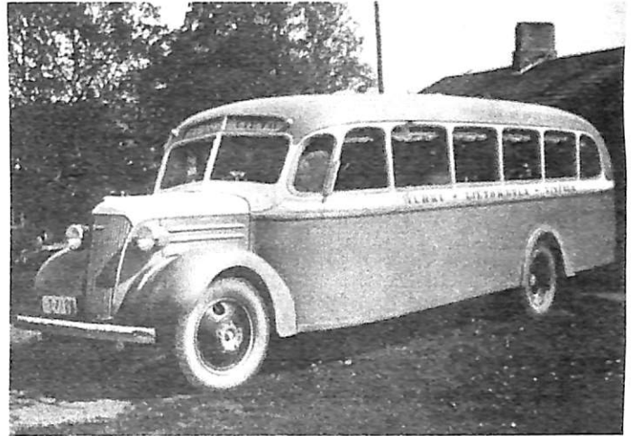
Ensimmäinen uusi auto. 1937 ostettu Chevrolet Oy Turun Autohalli Ab:n 24 hengen korilla.