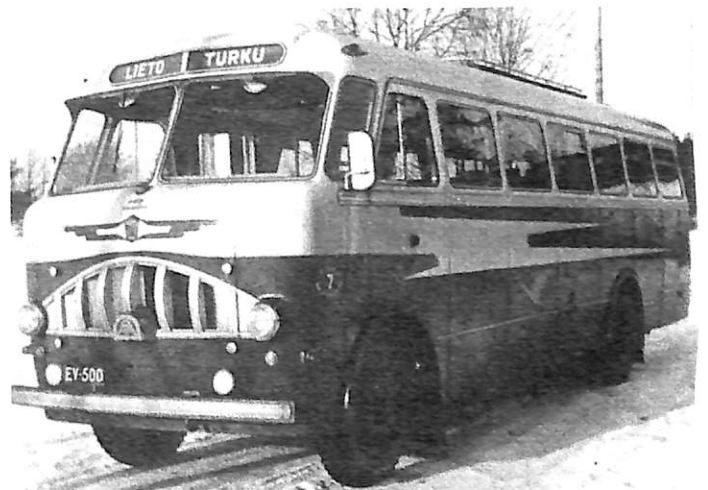
Autokori Oy:n korittama Fargo vuodelta 1957. Samanlainen maski oli myöskin vuonna -54 hankitussa Vanajassa ja "Mersussa" vuodelta -55.

Viellä 1960-luvulla Leiniön liikenteen tärkein linja oli Turusta Tampereentietä Liedon Sikilään kulkeva linja. Linja oli kannattava, vaikka sitä myöten liikkui vilkas läpikulkeva bussiliikenne. Ennen Turun moottoritien valmistumista 1967 kaikki pitkänmatkan liikenne Turusta Tampereen, Huittisten ja Loimaan suuntaan kulki nykyisen Vanhan Tampereentien kautta. Parhaimmillaan kymmenkunta eri linja-autoyrittäjä liikennöi tätä samaa vilkasta väylää.