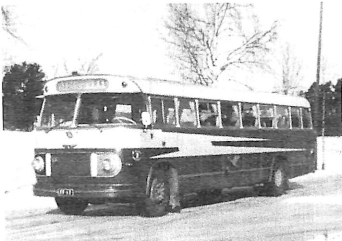
Ensimmäinen Wiima/Volvo vuodelta 1961 ja samalla ensimmäinen teräskorinen bussi.

Liikennöitsijöiden keskinäinen työnjako on säilynyt ja Valtasen Liikenne Oy ajaa Tampereentien paikallisliikenteestä kaksi kolmasosaa lopun jäädessä Leiniön Liikenne Oy:n hoidettavaksi. Liikenne on tosin hiljentynyt viime vuosina ja sunnuntailiikenne k.o. linjalla on lopetettu kokonaan.