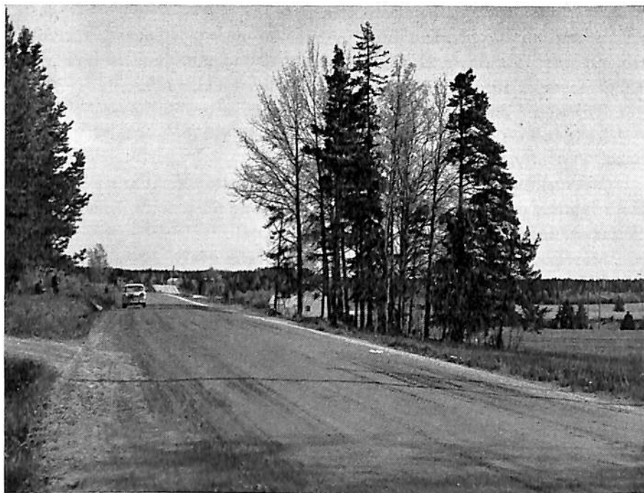
Tien oikealla puolella olevan metsikön kohdalla oli vuonna 1856 Euran venäläinen Kirkkoveräjänpellon sotilashautausmaa. Valok. 1964 A. Hirsjärvi (Kansallismuseo).

Kuun alkupuoliskolla vaihtelivat pakkanen ja suoja. Aurinko näyttyi muutaman kerran.